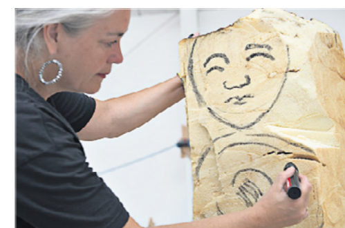
På det skib, der hedder "Minder", er der galionsfigurer, der forestiller ældre kvinder, der har levet i flere kulturer.