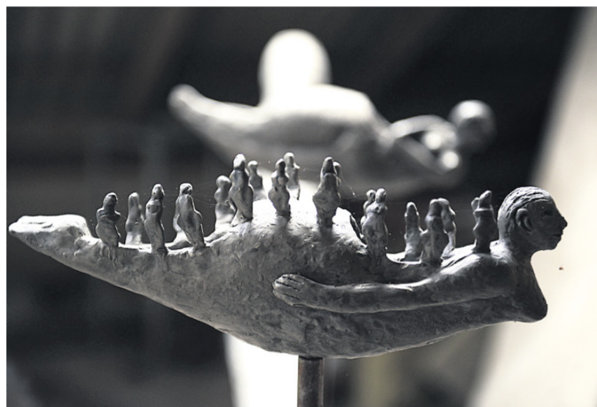
De små bronzemodeller har været udstillet mange steder for at gøre opmærksom på projektet.