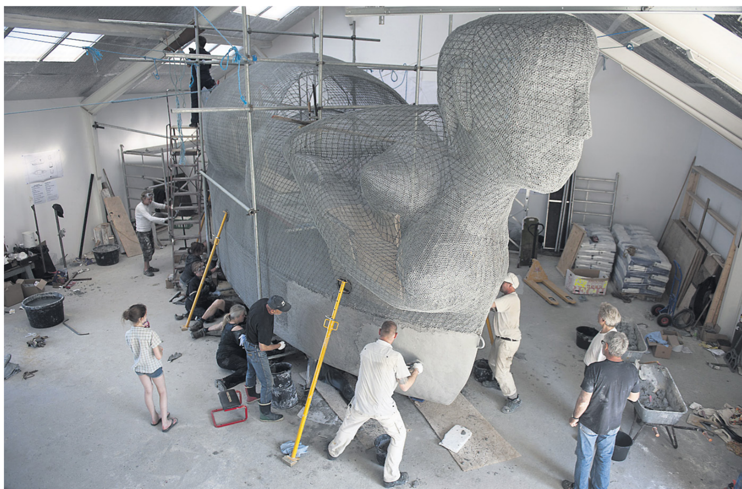
Over 100 frivillige var med, hver gang et skib skulle håndstøbes.