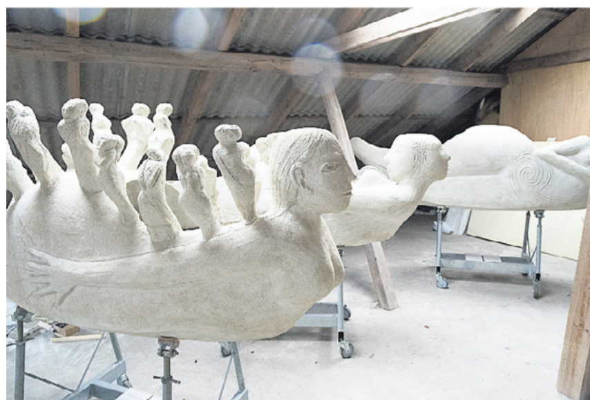
De tre kvindeskulpturer er blevet udført i mange størrelser. Nu står disse på værkstedets loft.

Mandskab ombord på jomfrurejsen er frivillige fra Støtteforeningen og frivillige i Europæisk Kulturhovedstad Aarhus 2017.