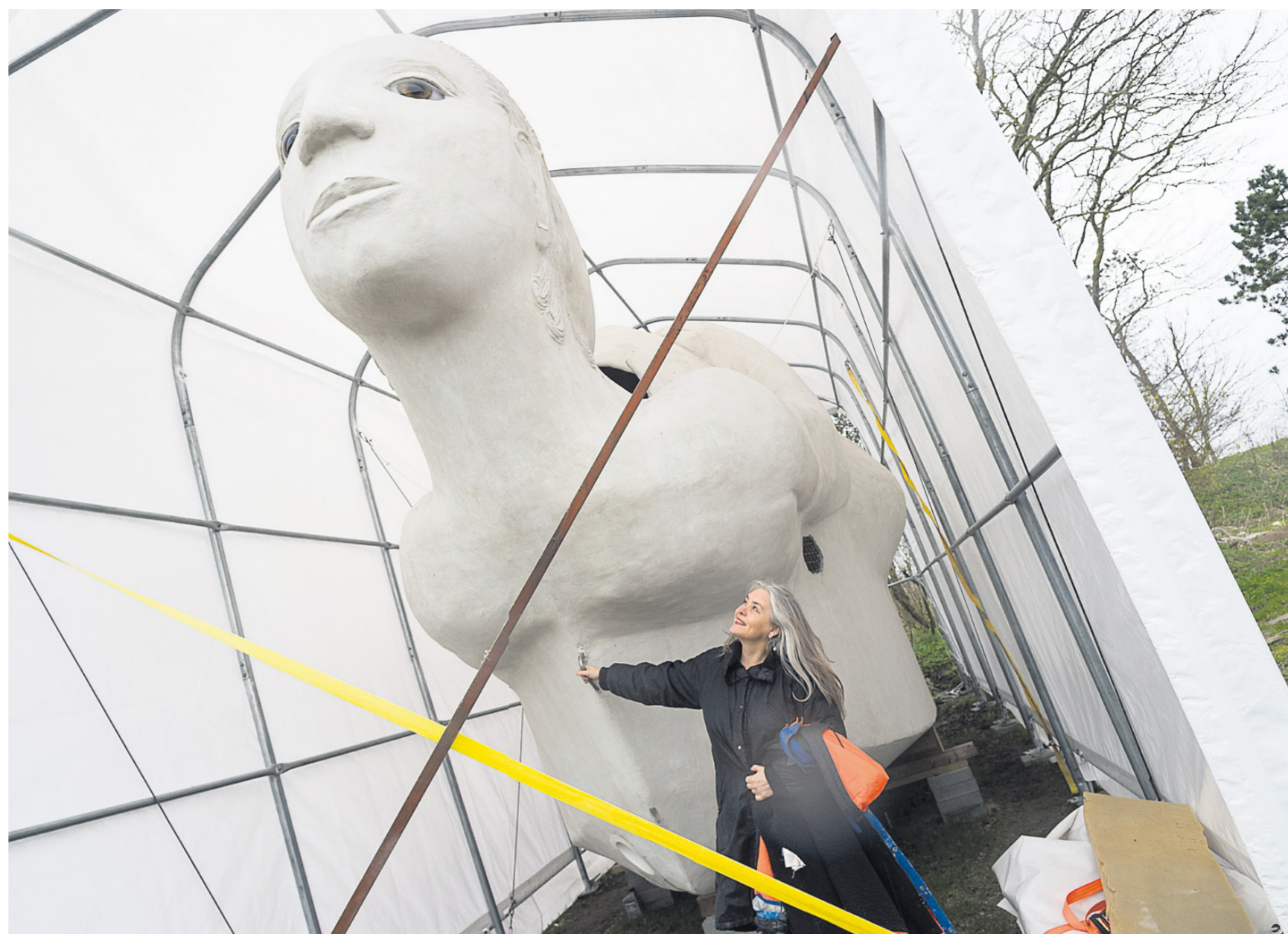
Installationen Life-Boats er klar til søsætning på lørdag.