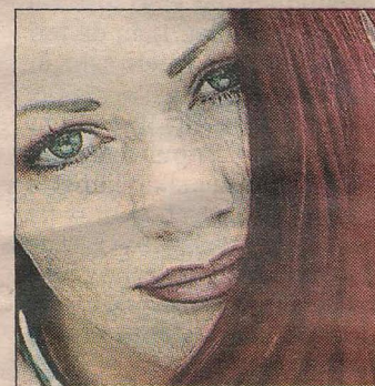
KOMMER: Unni Wilhelmsen kommer til Bakgården pub tirsdag 9. september.