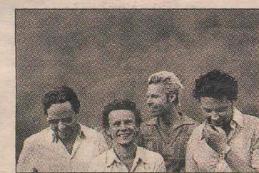
KOMMER: Bo Kaspers kommer til Rockefeller i Oslo 12. november.

Bandet har i løpet av sine ti år, siden debutten «Søndag i sängen», etablert en stor fan-skare, ikke bare i hjemlandet