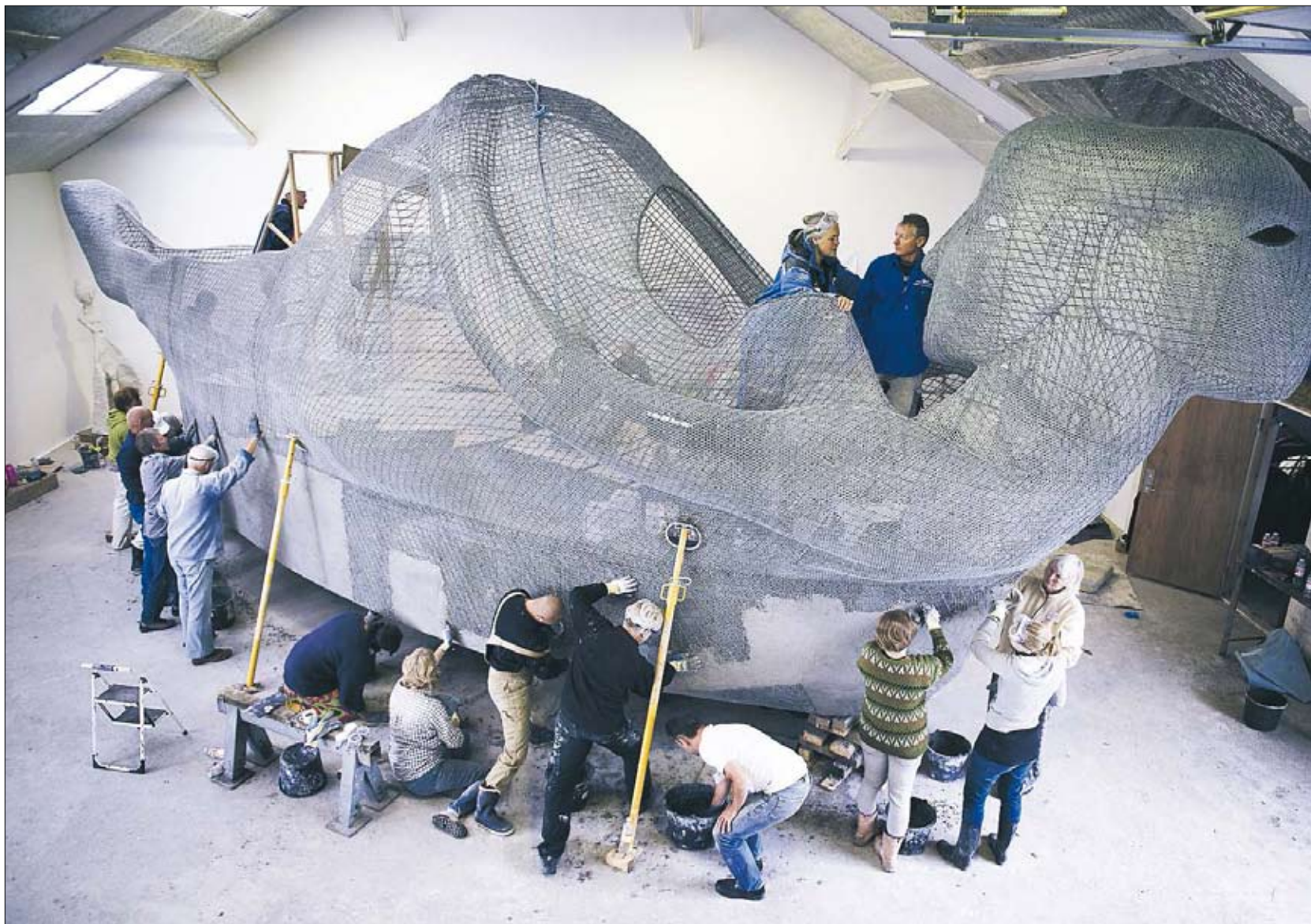
Båden påføres specialblandet beton med højt cementtal. Støbningen foregår ved, at der står personer inde i båden og presser beton igennem til dem, der står udenfor, som så presser tilbage i et samspil. Skelettet består af kyllingenet. Omkring 100 frivillige hjalp til med støbning, madlavning og meget andet i weekenden.

BENTHE NORHEIM, kunstneren bag Life-boats