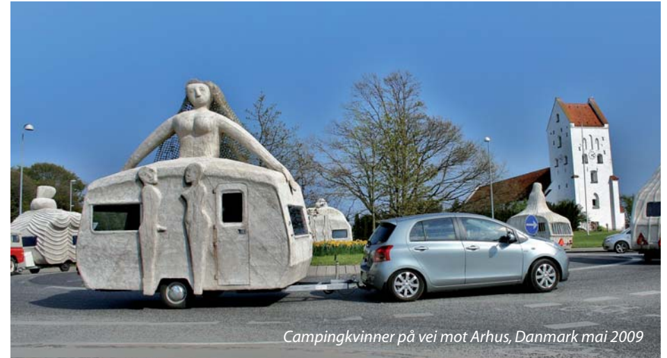
Campingvinner på vei mot Arhus, Danmark mai 2009