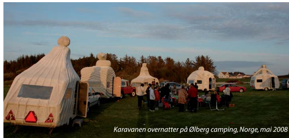
Karavanan overnatter på Ølberg camping, Norge, mai 2008

3) Maria beskytter: Musikken til Maria er skapt på basis av et verk jeg vokste opp med, Gregorio Allegri's Miserere - et korverk for åttestemmig kor, som i flere hundre år bare var tilgjengelig i det sitinske kapell i Roma. Men Wolfgang Amadeus Mozart ville det annerledes, og skrev det ned etter hukommelsen, og da ble det frigitt av paven. Dette verket