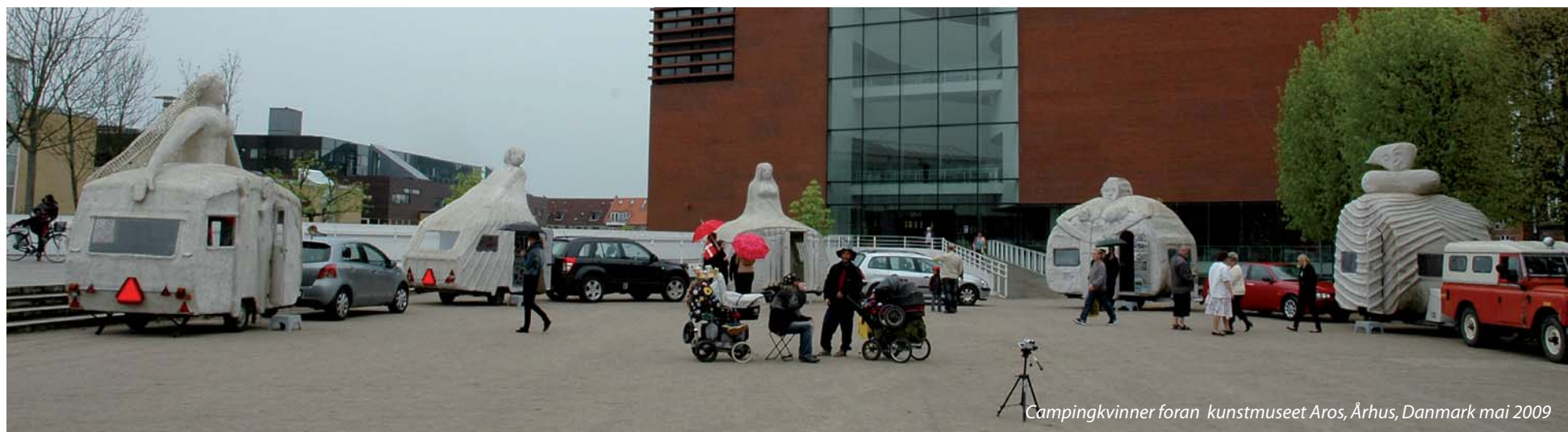
Campingvinner foran kunstmuseet Aros, Århus, Danmark mai 2009