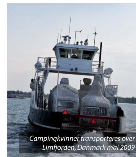
Campingkvinner transporteres over Limfjorden, Danmark mai 2009