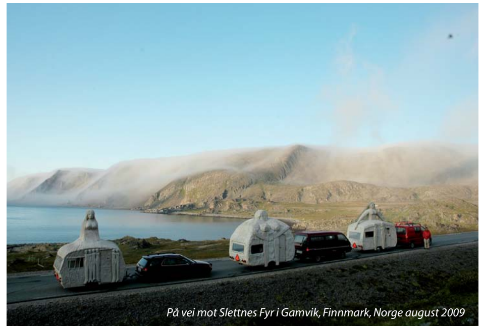
På vei mot Slettnes Fyr i Gamvik, Finnmark, Norge august 2009