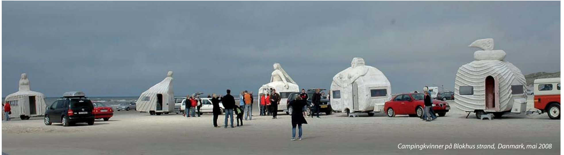
Campingkvinner på Blokhus strand, Danmark, mai 2008