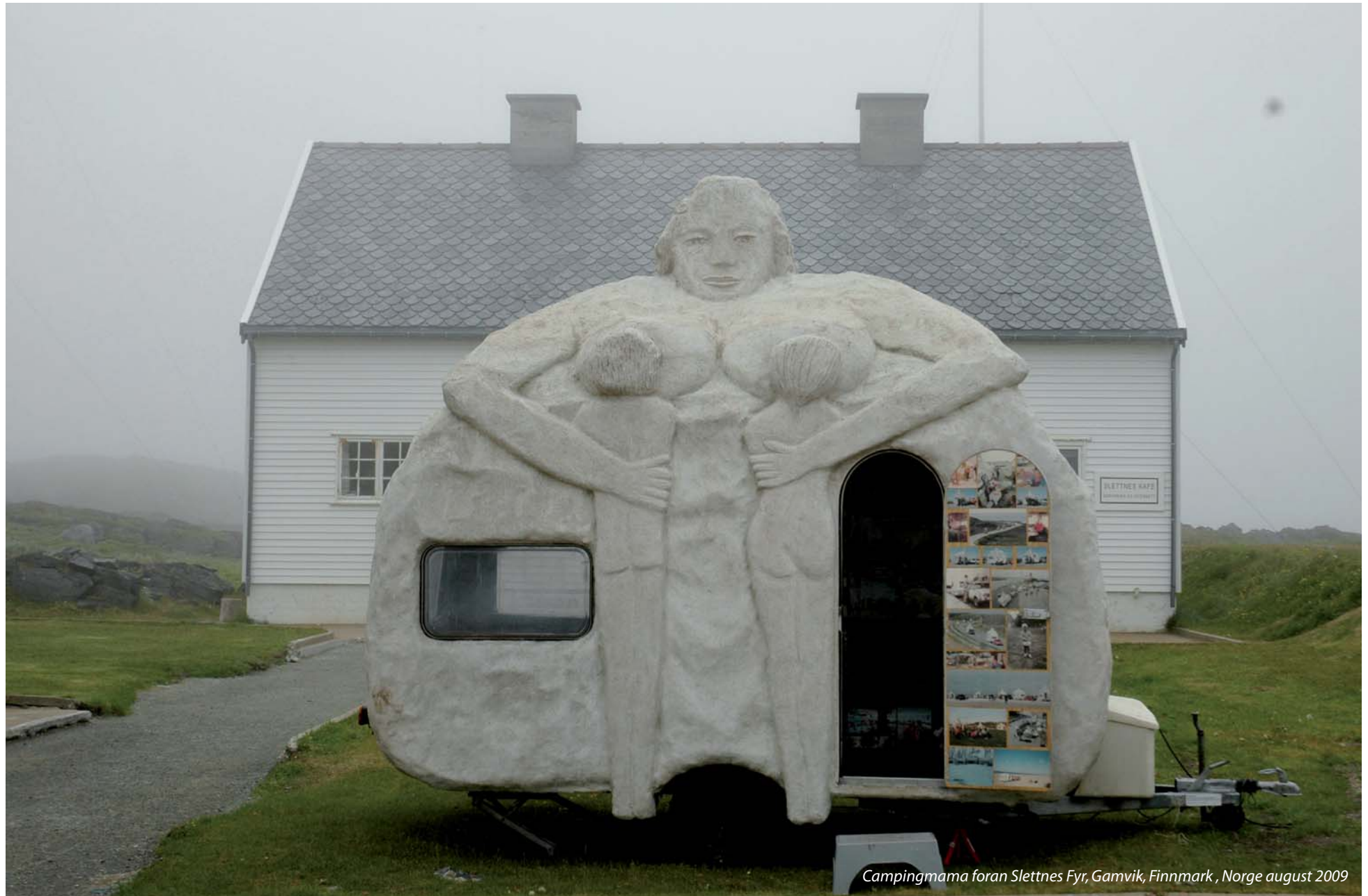
Campingmama foran Slettnes Fyr, Gamvik, Finnmark, Norge august 2009