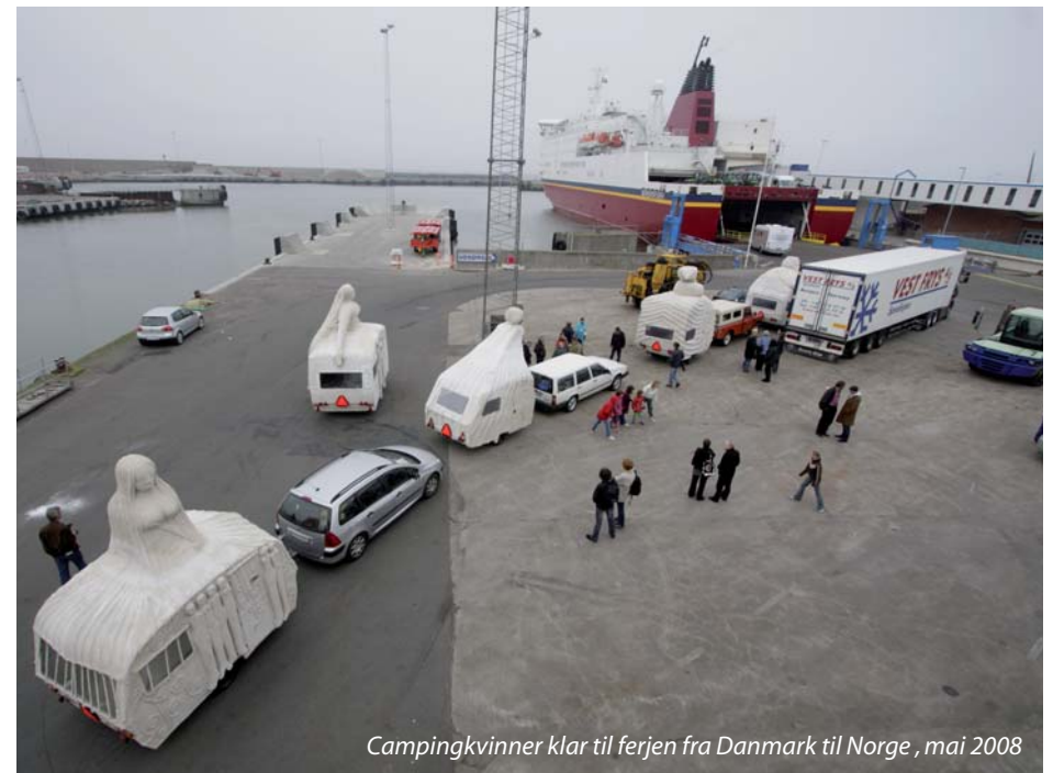
Campingkvinner klar til ferjen fra Danmark til Norge, mai 2008