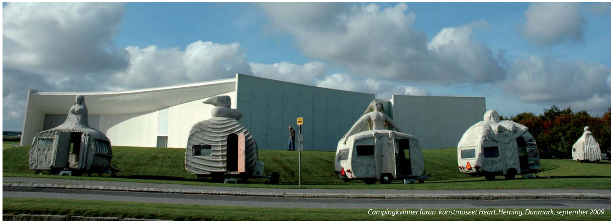
Campingvinner foran kunstmuseet Heart, Herning, Danmark, september 2009