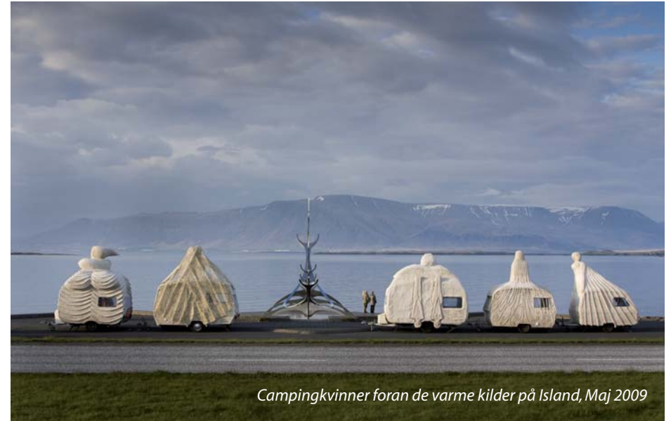
Campingkvinner foran de varme kilder på Island, Maj 2009