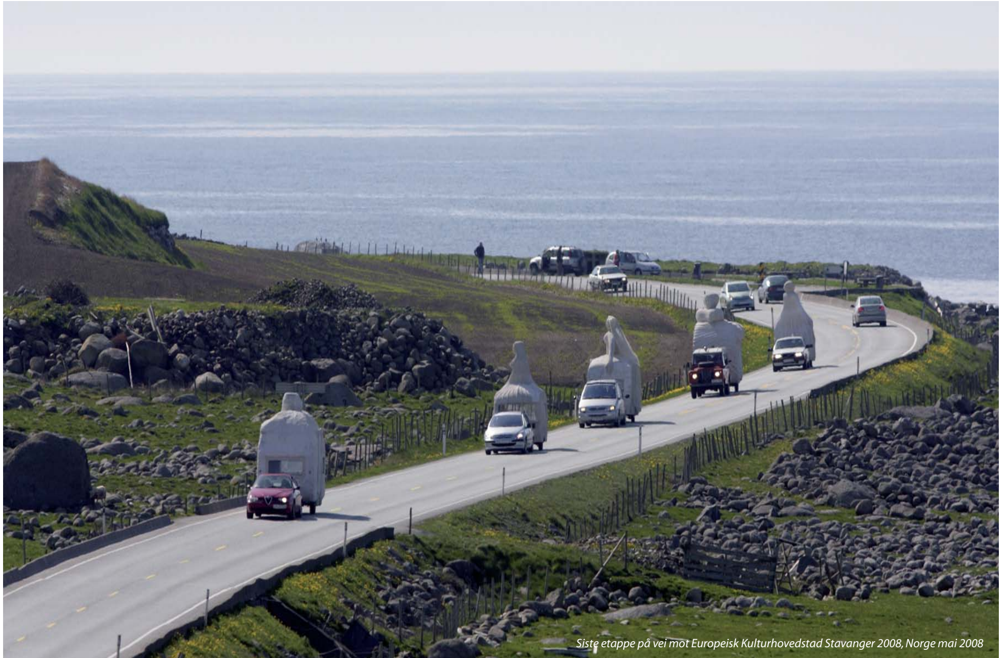
Siste etappe på vei mot Europeisk Kulturhovedstad Stavanger 2008, Norge mai 2008