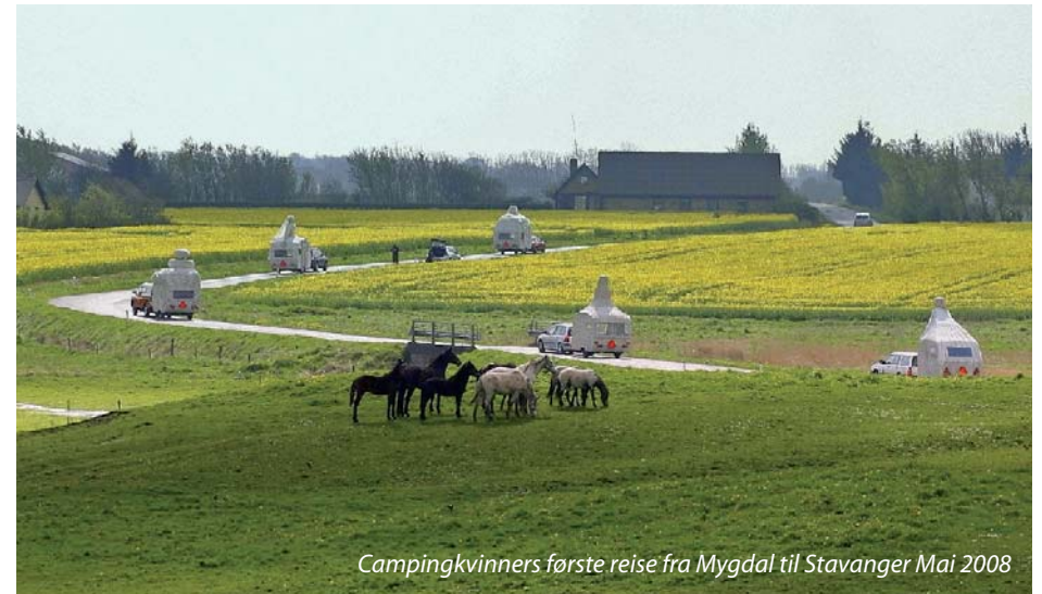
Campingkvinnerns første reise fra Mygdal til Stavanger Mai 2008

5) Campingmama er både mektig og omsorgsfull, men så veldig at man ikke vet om det er på godt eller vondt. Kontrollen glipper – ved det at to figurer er på vei ned med hodet først bak ryggen hennes. Hun er tapetsert innvendig med innsamlede fotos fra campinglivet.