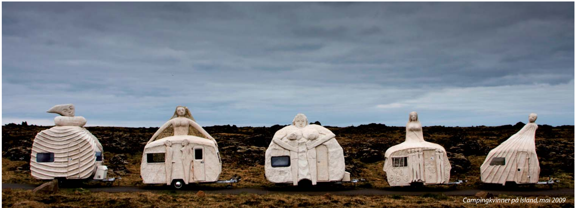
Campingkvinner på Island, mai 2009