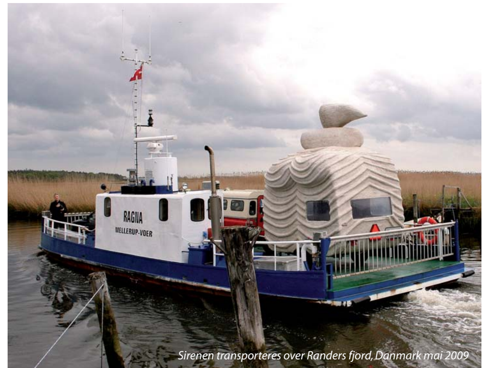
Sirenen transporteres over Randers fjord, Danmark mai 2009