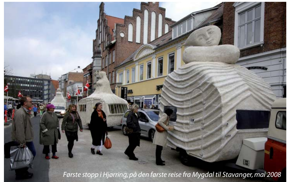
Første stopp i Hjørring, på den første reise fra Mygdal til Stavanger, mai 2008