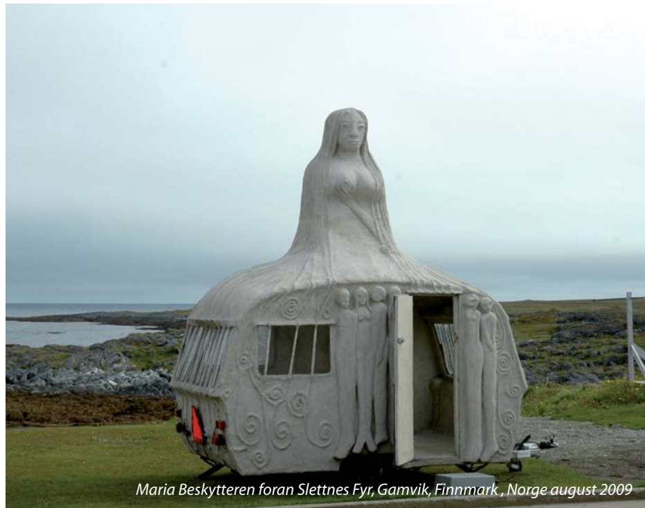
Maria Beskytteren foran Slettnes Fyr, Gamvik, Finnmark, Norge august 2009