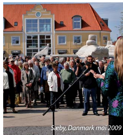
Sæby, Danmark mai 2009