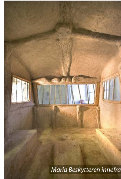
Maria Beskytteren innefra

Innsiden er dekket av en porselens-mosaikk skapt av ca 400 barn og flyktningekvinner fra Stavanger 2008 –regionen i samarbeid med Figgjo Porselensfabrikk. De har arbeidet i dialog med en tematikk som understreker alle flyktende kvinner og barns lengsler og savn.