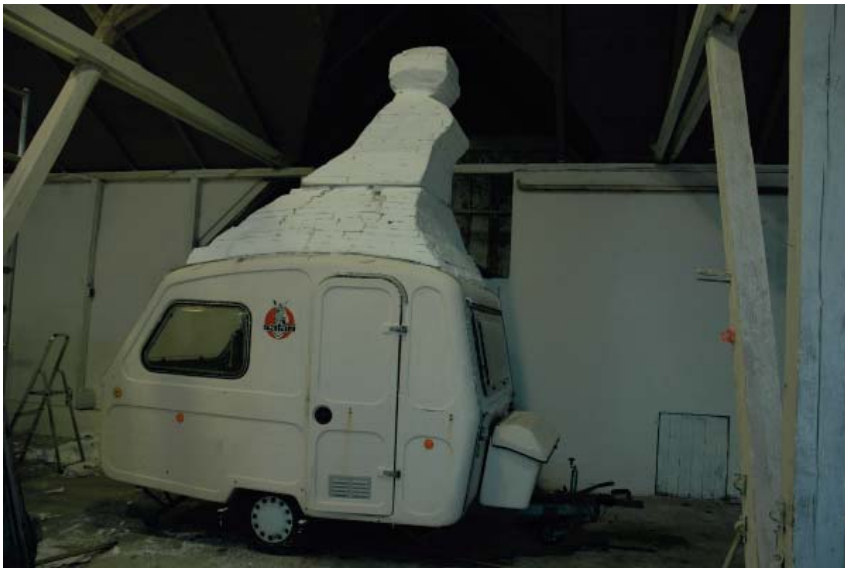
2. CampingKvinne, Flyktingen, under bearbeidelse i mitt verksted