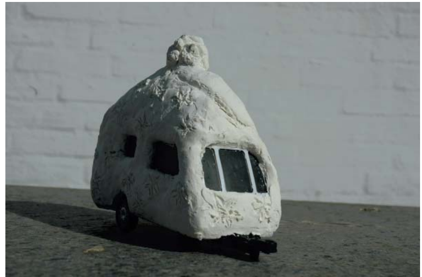
Modell til 4. Campingkvinne, CampingMama. målestokk 1:36