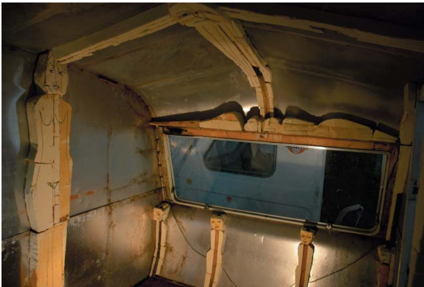
Fotoene viser tegninger gjort på innsiden av campingkvinnen, forsterket av tegninger på fotoet, for å illustrere ideene.