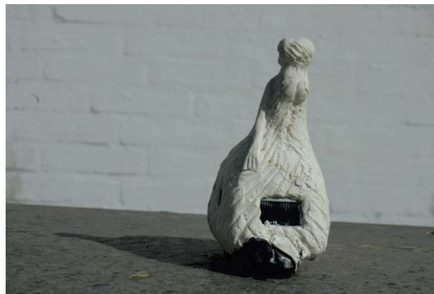
Modell til 2. Campingvinne, Flyktningen. Målestokk. 1:40