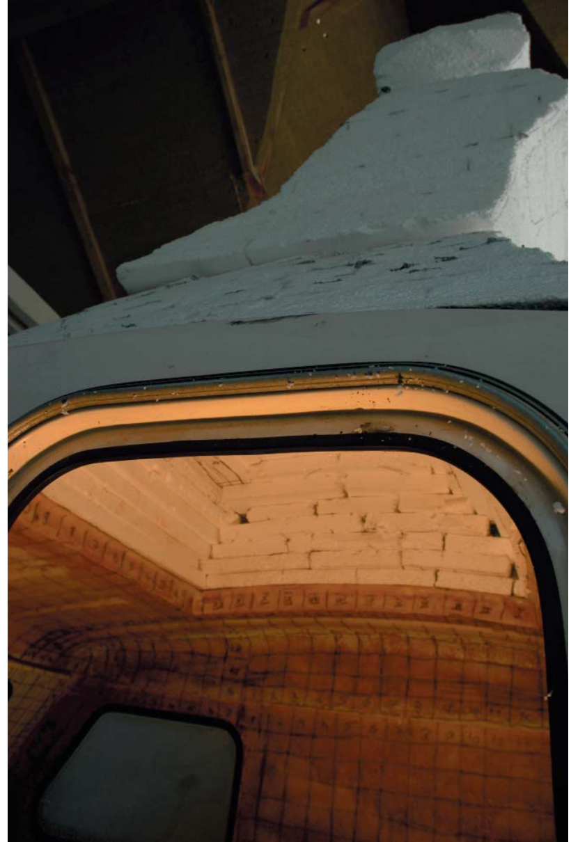
Detaljfotos av 2. CampingKvinne interiør under bearbeidelse