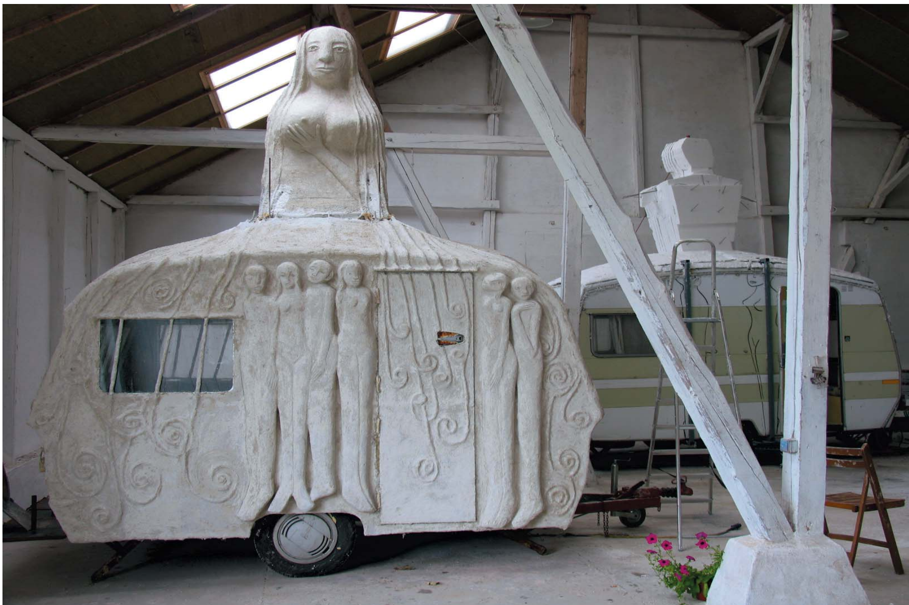
1. CampingKvinne, Beskytteren. Modell målestokk 1:1