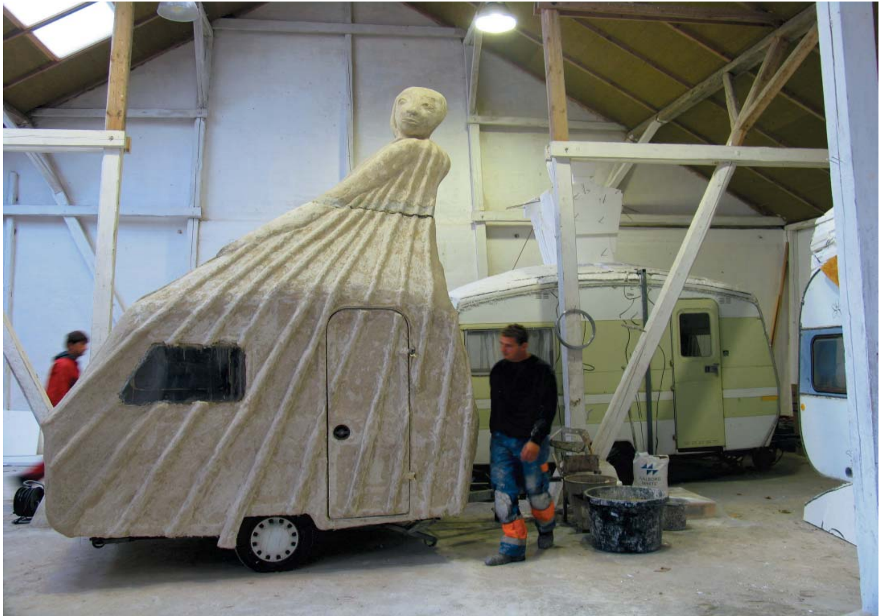
2. Campingkvinne, Flyktingen. Målestokk. 1:1