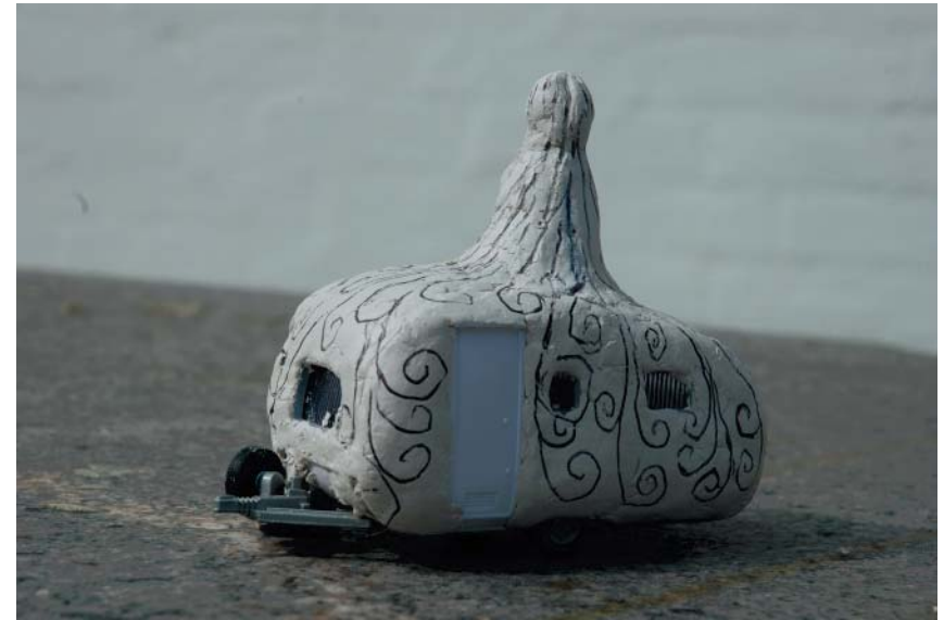
Modell til 1. CampingKvinne, Beskytteren. Modell målestokk 1:40