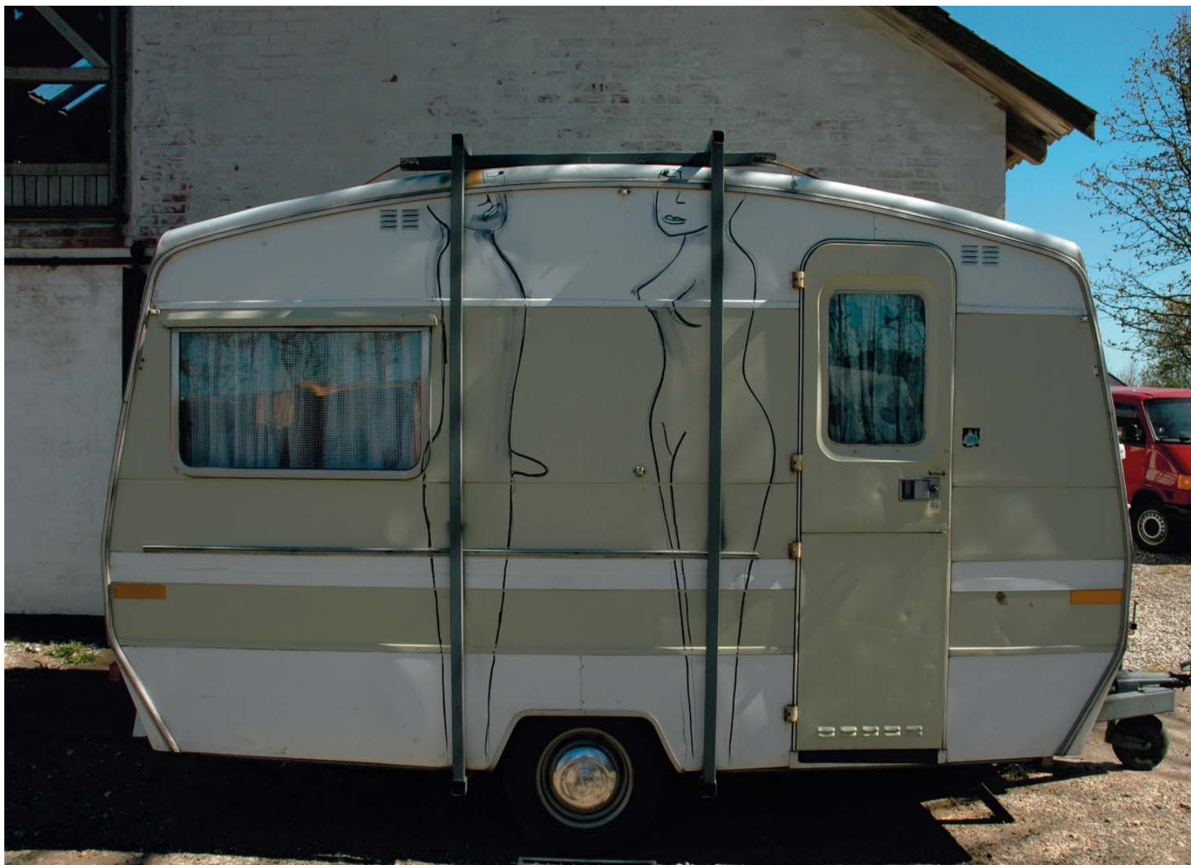
3. CampingKvinne, Bruden. målestoll 1:1