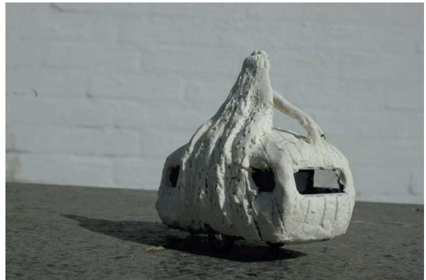
Modell til 3. Campingkvinne, Bruden. Modell målestoll 1:40