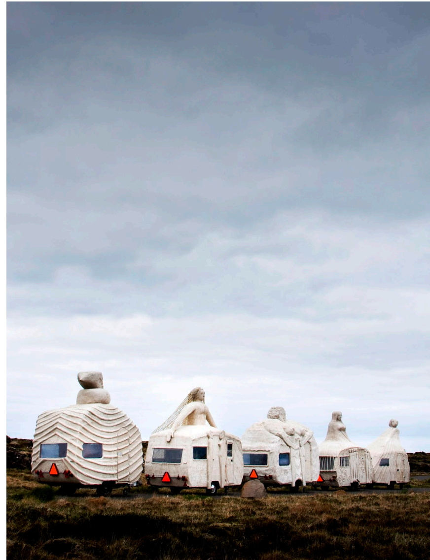
Campingkvinder på Island til Reykjavik Arts Festival

”Kunstneren bruger det offentlige rum til at skabe en tættere og mere personlig kontakt med publikum og grupper i den lokale befolkning. For herigennem at rejse spørgsmål om identitet i relation til et specifikt sted, om forholdet mellem individ og samfund.”