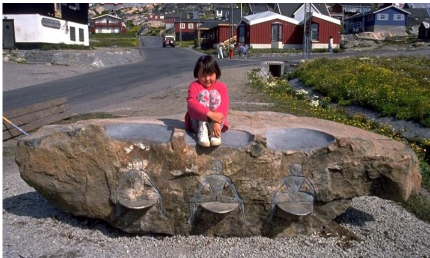
Elskovsbæk, Qaqortoq, Grønland 1994