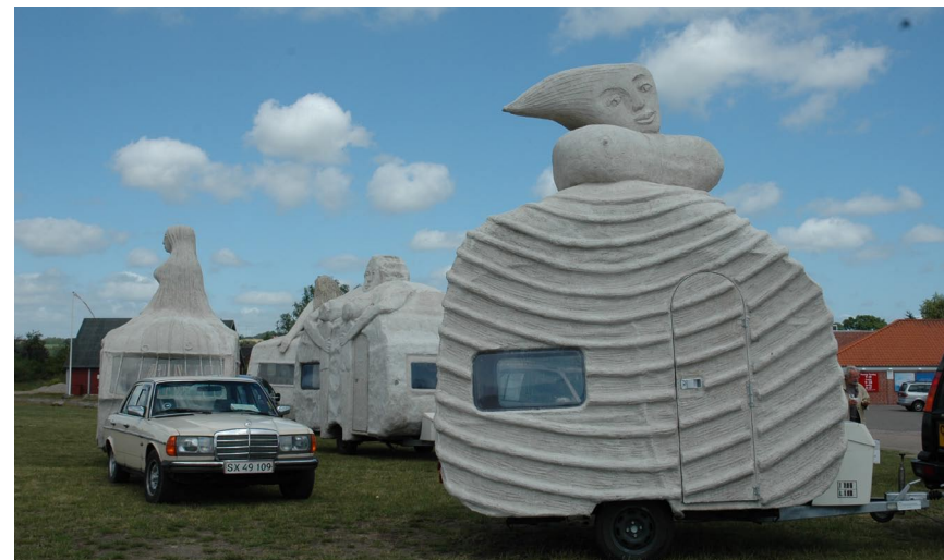
Sirenen på vej til Kunstcentret Silkeborg Bad 2009