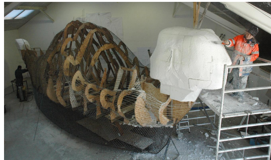
"Mit skib er ladet med Liv", i værkstedet, april 2013