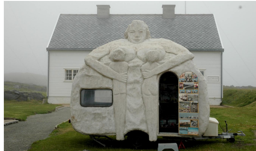
Campingmamma, Slettnes fyr, Gamvik Nord Norge 2009

Campingkvinderne indrammer de steder, hvor de bliver placeret, og giver dem nye betydninger. De inviterer beskueren til at opleve noget anderledes og uventet, samtidig med at de understreger bevægelseslinier i miljøet og indstifter nye blikretninger. Gennem de fem Campingkvinder viser Marit Benthe Norheim, at billedkunsten rummer en særlig san-