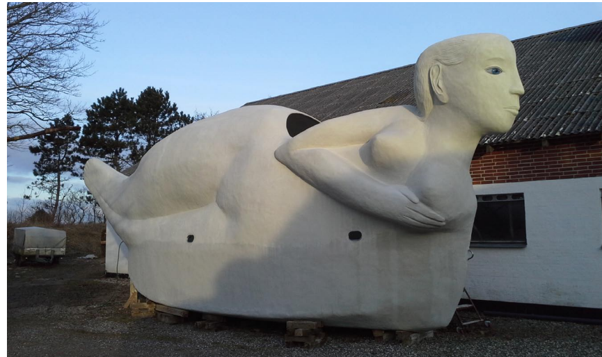
Den første skulpturbåd "Mit skib er ladet med Længsel"

Både Campingkvinderne og de andre bevægelige rullende skulpturer, der på forskellig måde rummer musik, indeholder kunstnerisk kvalificerede tolkninger af vor verden, der er i stadig forvandling. De giver mulighed for nysyn og skabelse af nye relationer på tværs af gammelkendte grænser. Når nu Campingkvinderne skal bo på Aalborg Universitet, der på en forbilledlig måde er meget åben og eksperimenterende, vil de kommunikere direkte med lærere og studerende og appellere dem til at spille aktivt med og fortsætte de fortællinger, de visualiserer. Vi bliver en erfaring rigere gennem de