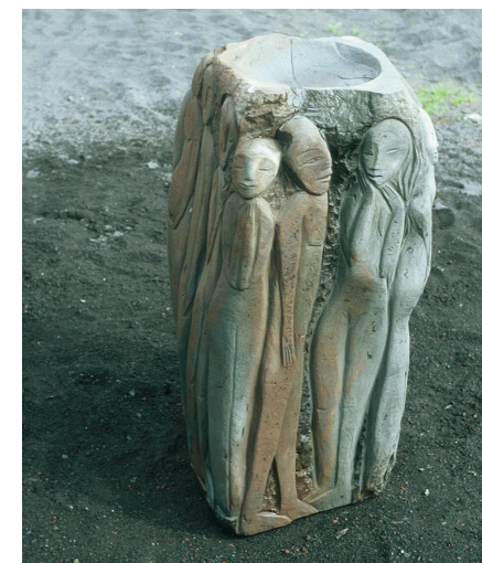
Døbefont til stavkirken på Vestmannaeyr, Island 2000