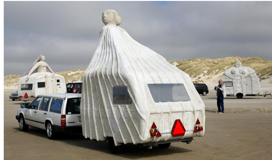
Flygtningen på Blokhus strand 2008

Flygtningen er en både stolt og sårbar kvindeskikkelse, der skuer ind i en uvis fremtid. Inde i campingvognen har 400 norske børn og flygtningekvinder tapetsret væggene med mosaikker, der skildrer flygtningenes savn og håb. Dette tema har Geir Johnsen intensiveret gennem sin musikalske bearbejdning af den palæstinensiske nationalpoets berømte værk Belejringstilstand (2002). Sirenen rummer en nutidig skulpturel tolkning af den forførende sirene fra den græske mytologi, der lokker søfolk til sig for derefter at lade dem lide skibsbrud. Sådan foregår forførelse ofte også i dag. I Maria Beskytteren møder vi en moderne skildring af det barmhjertighedstema, der ofte bliver forflygtiget i en tid hvor individualismen har en så central plads. Bruden har stor erotisk udstråling, men alle de bryllupsbilleder, der findes inde i campingvognen, viser forskelligheden i opfattelsen af ægteskabet og peger flere steder indirekte på de ofte vanskelige vilkår, en brud kommer til leve under. Campingmama er stor og