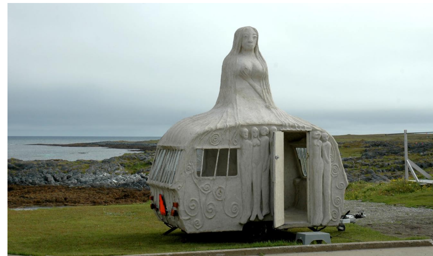
Jomfru Maria, Slettnes fyr, Gamvik Nord Norge 2009