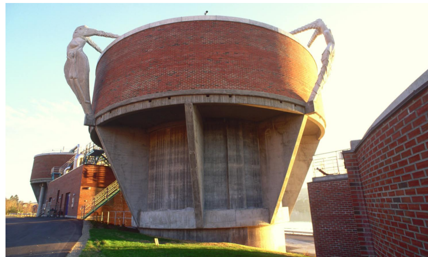
Damer i blæst, Union/ Norske Skog, Skien 1996