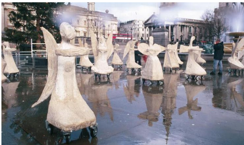
Rullende Engle, Trafalgar Square 2000