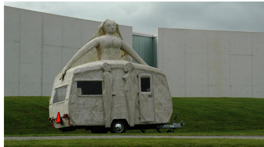
Bruden, foran Herning Kunst museum Heart