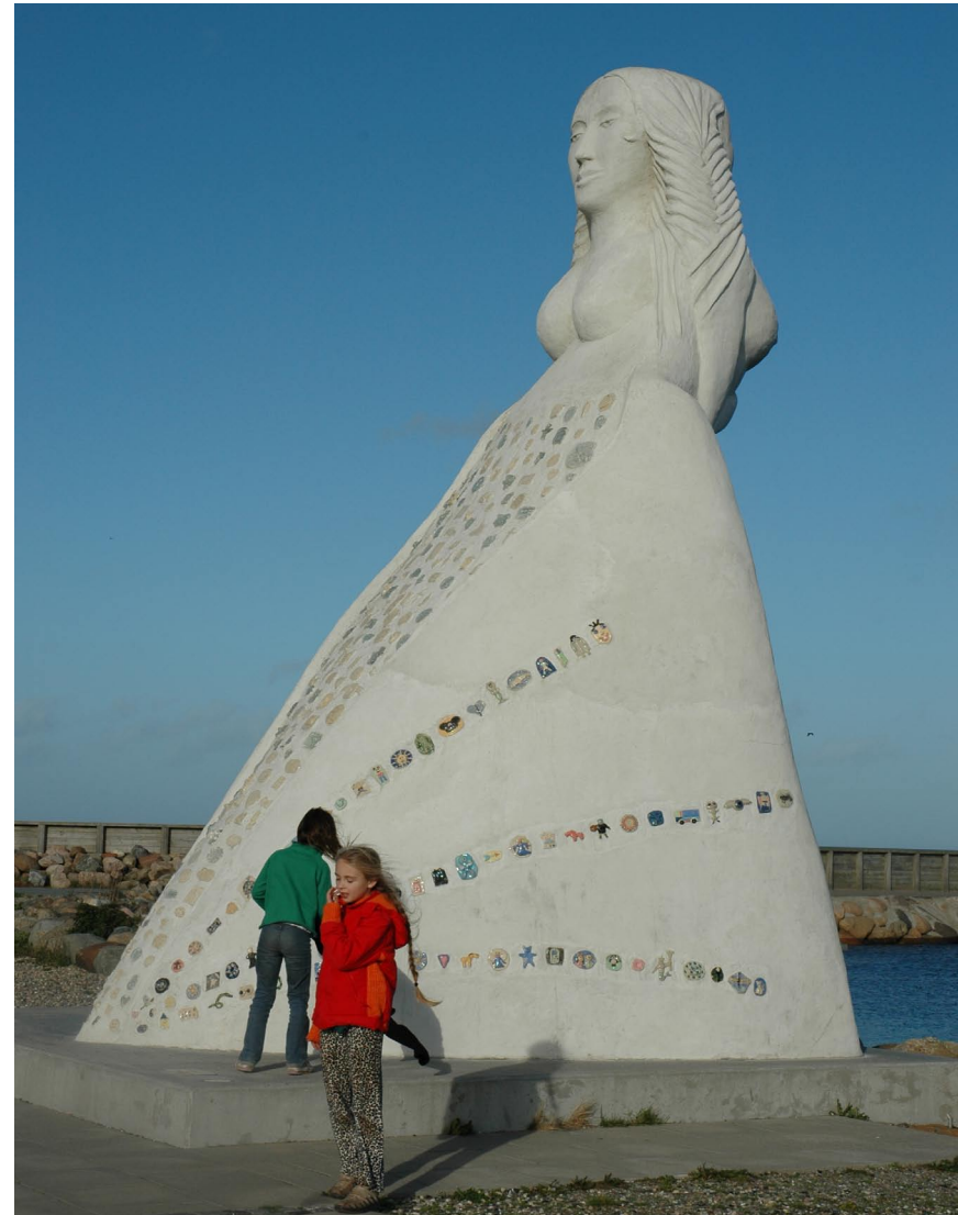
Fruen fra Havet, Sæby havn, 2001

Rottejomfruen (2006) rummer en monumental og original skulpturel tolkning af hovedtemaet i et andet af Ibsens dra-