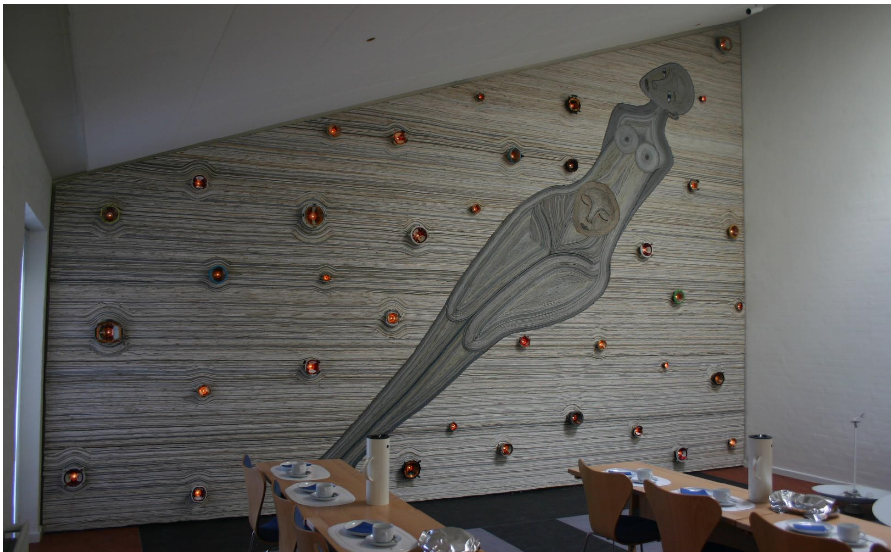
Ledningsgobelin, foredragssalen på AVV (Affaldsvæsenet Vendsyssel, Danmark) 2004