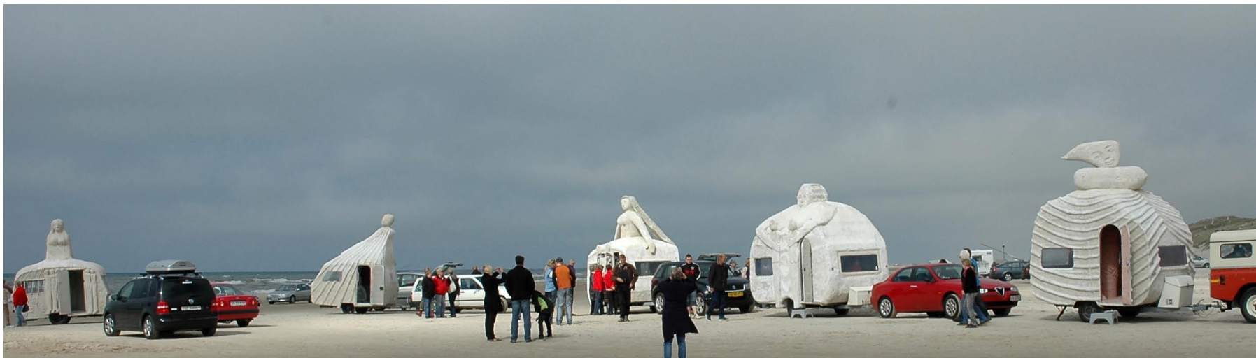
Campingkvinder på vej til Stavanger Europæisk Kulturhovedstad 2008, med stop ved Blokhus strand

Den internationalt kendte norske arkitekturteoretiker Christian Norberg-Schulz har understreget, at det er vigtigt at både billedkunstnere og arkitekter – snart sammen – snart hver for sig – formår at visualisere, hvad han kalder ”stedets ånd.” Den danske billedhugger Bjørn Nørgaard har peget på, at især større projekter i det offentlige rum kan ændre vor