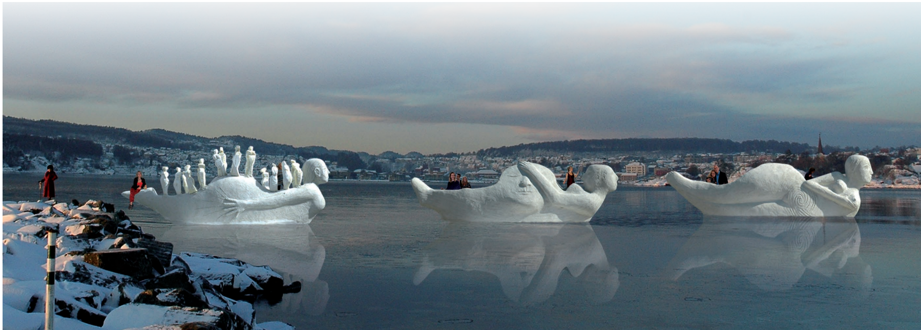
Life-boats i Larvik fjorden, Norge (fotomontage)