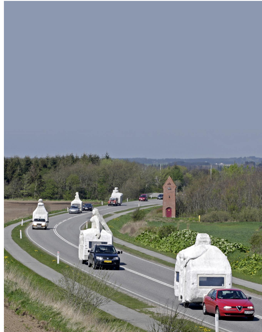
Campingkvinder på vejene i Vendsyssel, 2008