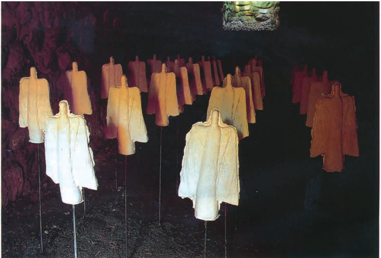
Slovaken Ivica Langerová-Viderová's skare av engler, installert i en nedgravd bunker ved Lista fyr. (Foto Jan-Erick M. Gutiérrez).