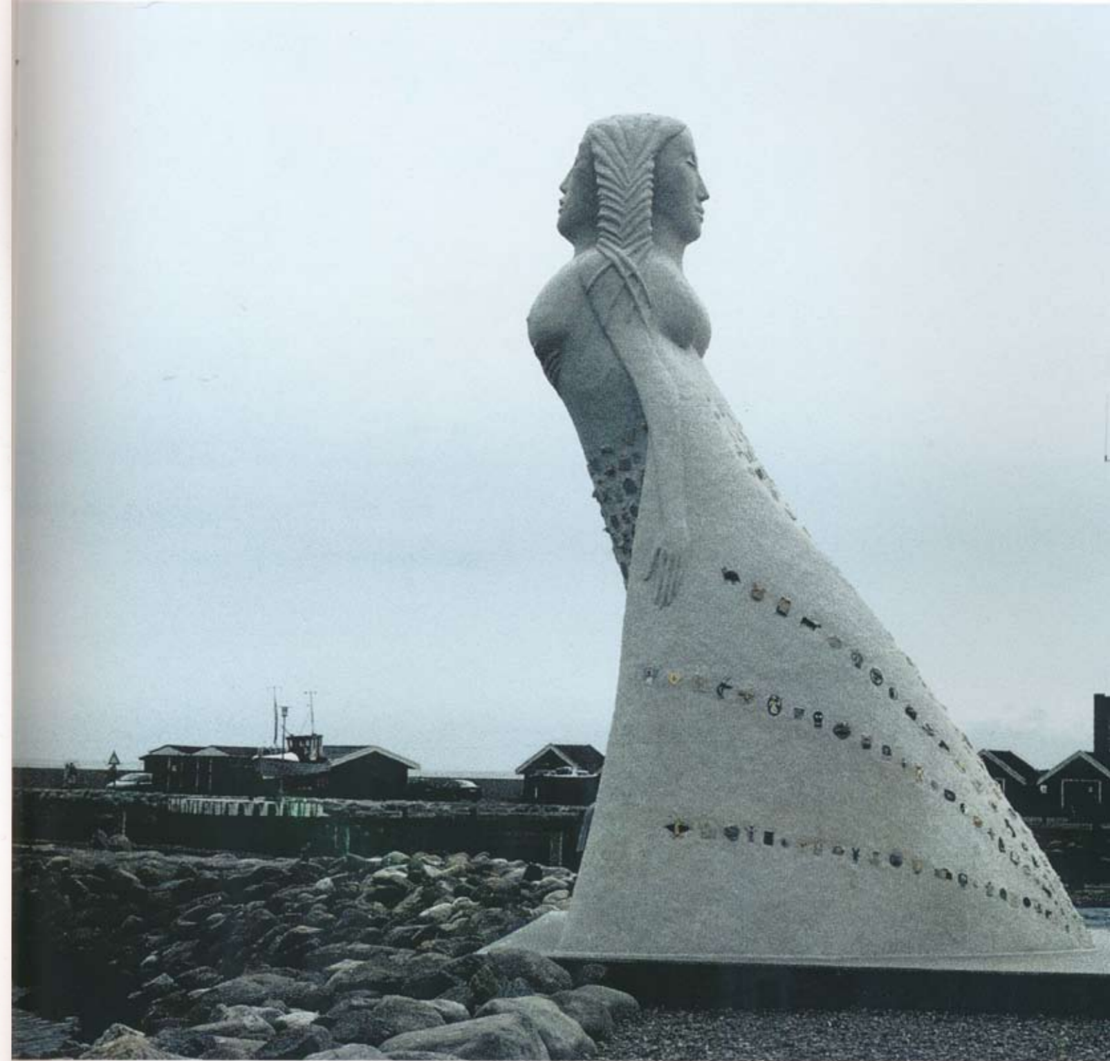
Fruen fra havet Woman of the Sea

Jeg vil slutte av med å si at jeg skulle ønske alle som var med til å lage "Fruen fra havet" kunne stå her sammen med meg; - Alle barna, ingeniøren, håndverkerne, barnepasserne, administratorene, lærerne, pedagogene, assistentene på forskjellige deler av prosessen, sponsorene, venner og familie som har støttet hele veien - så ville vi se hvor mange som har vært med til å trekke lasset sammen!