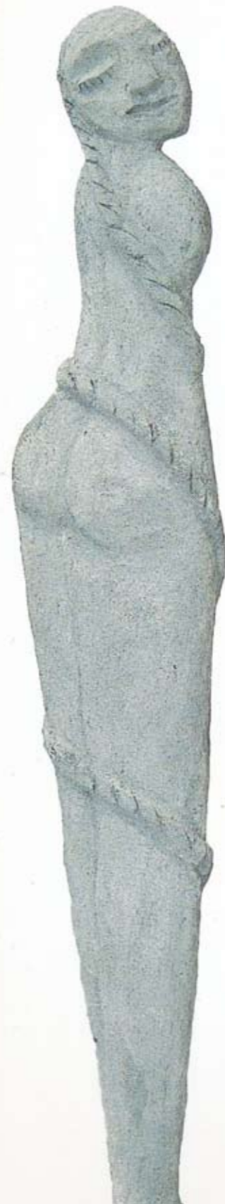
Skulptur / Sculptures 2001-2003