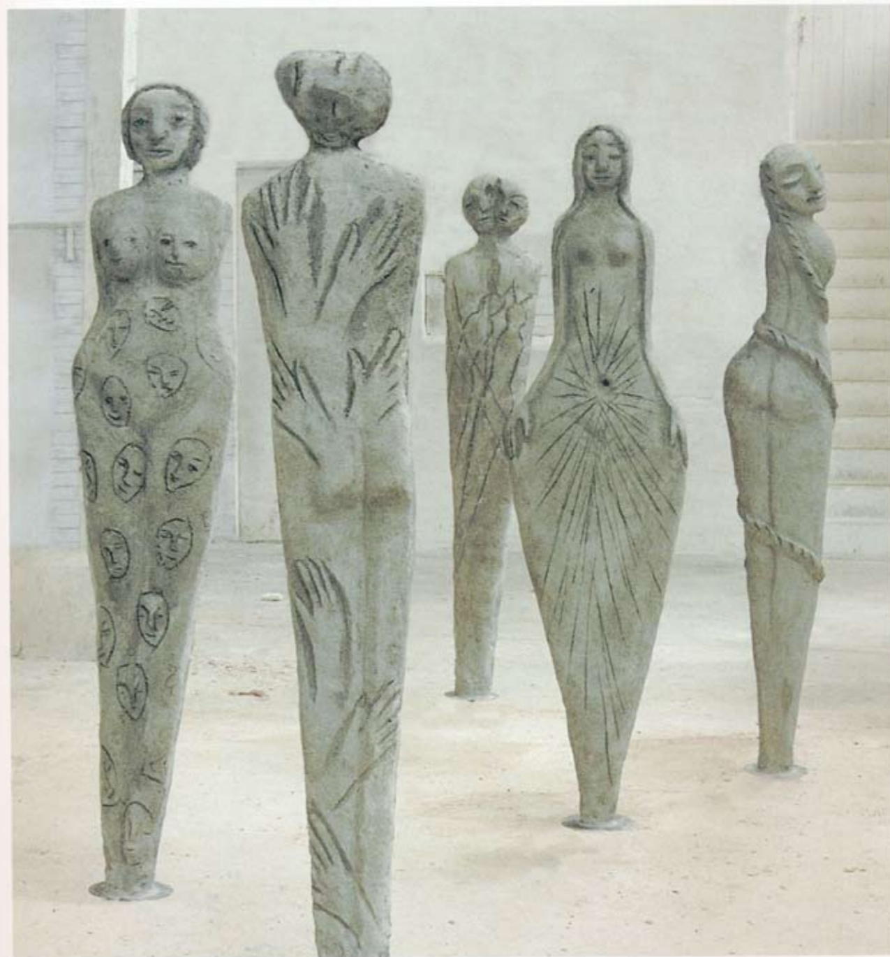
Familien 2003 5 roterende figurer Betong H. 220 cm The family 2003 5 rotating figures Concrete H. 220cm