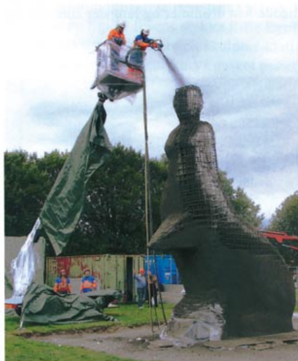
Illustration 2: Rottejomfruen i proses

På en måte kan man si at Rottejomfruen også ville 'rense', og fri menneskene fra det som var vondt, først og fremst rottene som var en plage for menneske-