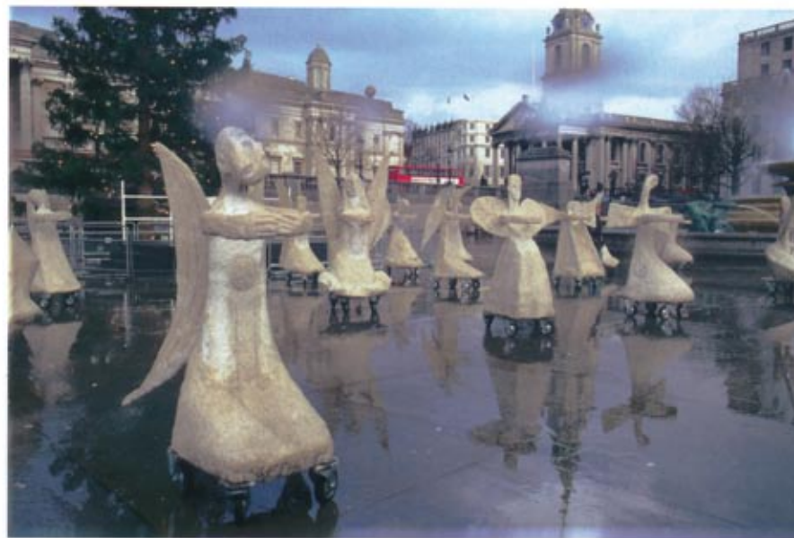
Illustration 2: "Englar på Trafalgar Square"