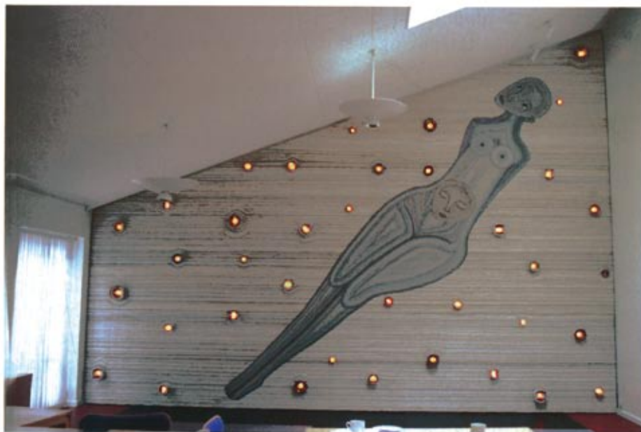
Illustration 5: "Ledningsgobelin"