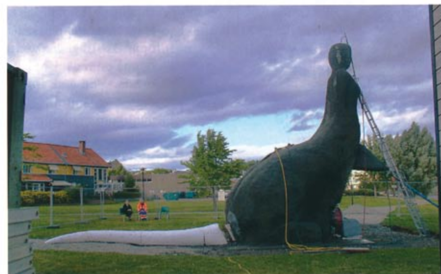
Illustration 1: Rottejomfruen i proces