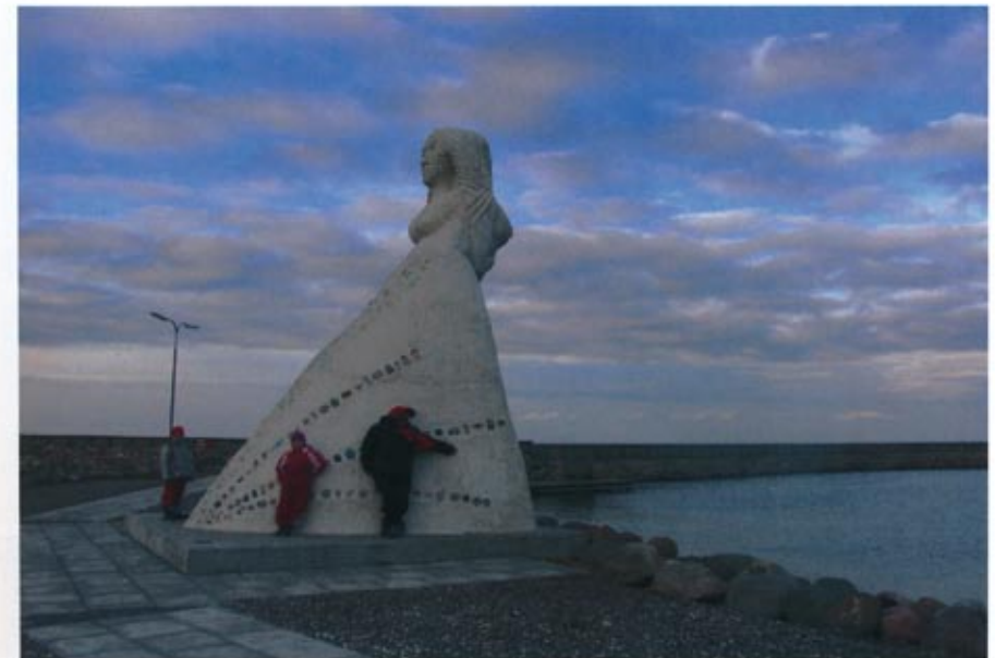
Illustration 3: "Fruen fra havet"

En av englene besøkte alle 12 institusjonene og ble en tid på hvert sted. Samtidig turnerte jeg med et lysbildeforedrag om min egen innfallsvinkel til å arbeide med beskyttelsestematikk.