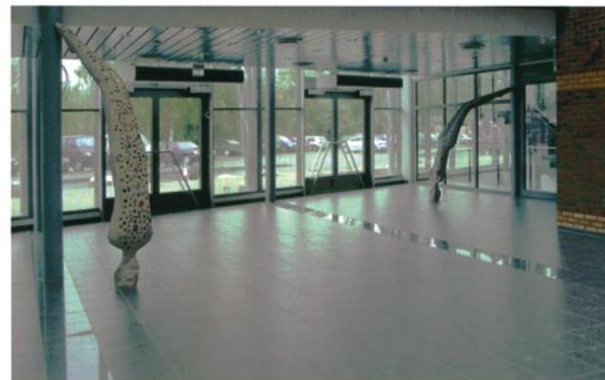
Illustration 4: "Medaljens forside"

"Rullende engler" brakte også en annen utsmykning på overraskende vis. Avfallsvesenet i Hjørring, AVV, identifiserte seg med englene på grunn av avfallsstativene de er bygd opp omkring. De ble avbildet både inne i og utenpå deres avfallsbrosjyre og jeg ble bedt om å lage en utsmykning til deres foredragssal laget av gjenbruksmaterialer. Jeg opplevde bedriften som en moderne "Askeladden"/"Klods-Hans", hvor deres prinsipp er at alt kan brukes og gjenbrukes, det fins muligheter i alt. Da jeg fikk se bunkene av ledninger etter demonteringen av elektriske artikler, så jeg dem plutselig som navlestrenger til vår moderne sivilisasjon. En fruktbar kvinne ble limt sammen av flere tusen meter brukte ledninger og har blitt gjenvinningsanleggets ansikt utad på mange måter. "Ledningegobelin" (2004) ble en iscenesettelse som tydelig ga virksomheten en understreket identitet. Det å gi verdi til det utstøtte er et tema jeg også brukte i produksjonen av englene og som innholdsmessig igjen henger sammen med skulpturen Rottejomfruen, som jeg skal avslutte med.